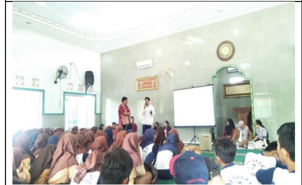
Tahap Penyampaian Materi