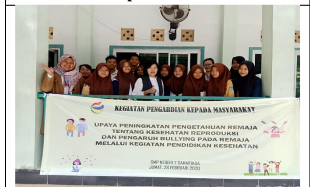
Tahap Post Test