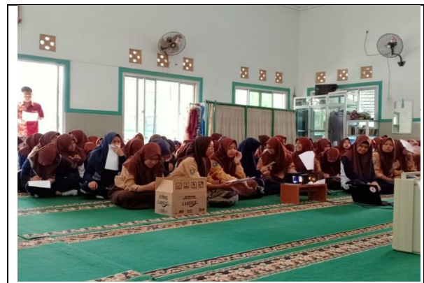
Pelaksanaan Pre Test