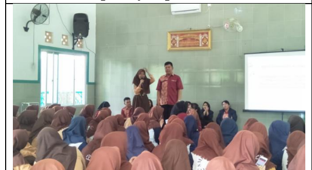
Tahap Sesi Diskusi